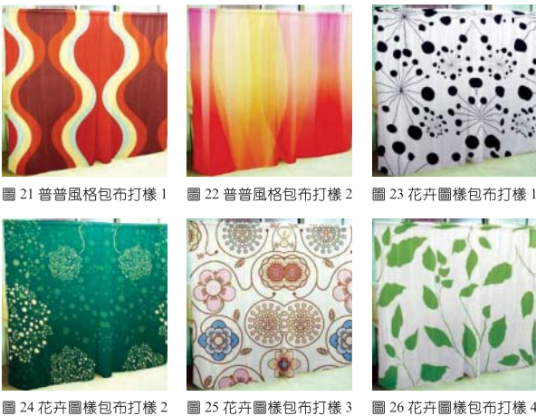
圖 21 普普風格包布打樣 1 圖 22 普普風格包布打樣 2 圖 23 花卉圖樣包布打樣 1 圖 24 花卉圖樣包布打樣 2 圖 25 花卉圖樣包布打樣 3 圖 26 花卉圖樣包布打樣 4