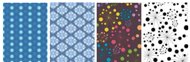
圖 13 花卉圖樣 1 圖 14 花卉圖樣 2 圖 15 花卉圖樣 3 圖 16 花卉圖樣 4