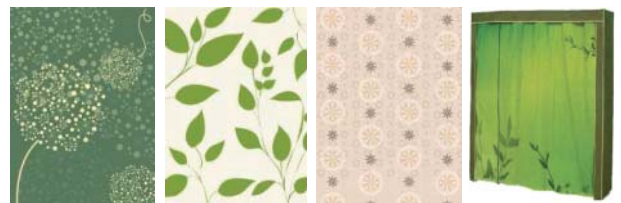
圖 17 自然大地圖樣 1 圖 18 自然大地圖樣 2 圖 19 自然大地圖樣 3 圖 20 電腦合成模擬打樣圖

經過 8 大風格設計與提案、研修過程，以及廠商會議、設計師專家內部會議後，在第二階段正式設計決定採用目前市面上較為常見設計風格的普普風，以及較具有獨特異國風格的花卉圖樣兩系列進行設計。並以採用可運用噴墨印刷條件之單透布進行實品打樣，最終設計完稿之六件風格櫥櫃架包布設計圖片如圖 21 至圖 26 所示。