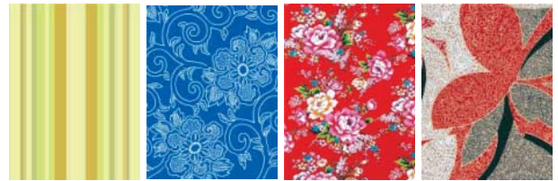
圖 9 歐普藝術圖樣 5 圖 10 華麗風格圖樣 1 圖 11 材質選用 1 圖 12 材質選用 2