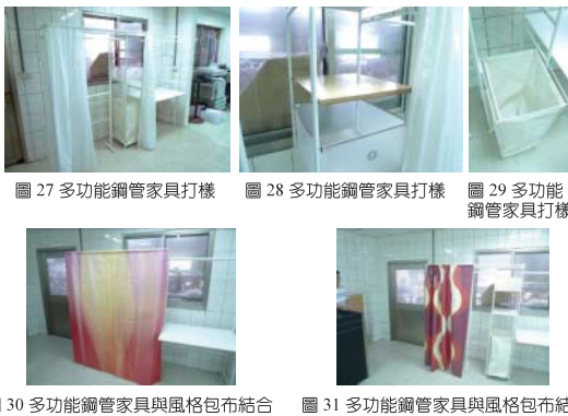
圖 27 多功能鋼管家具打樣 圖 28 多功能鋼管家具打樣 圖 29 多功能鋼管家具打樣 圖 30 多功能鋼管家具與風格包布結合 圖 31 多功能鋼管家具與風格包布結合

現代人因為經濟不景氣，薪資銳減，也因此多數的年輕上班族為無殼蝸牛的租屋族，同時也因為薪資縮減，選購家具的預算就更為減少，因此在揀選家具的同時，會以必要性與機能性做為考量，此外，此類族群可能1~2年就會有搬家的可能，因此多數的租屋族群會希望家具可以好收納，並且易於搬送。為了因應租屋族群這樣的需求，發展出多功能鋼管家具系列，以易於組裝和搬運為出發點，同時考慮到現代人所要求的機能性，來做一個整合式的設計，以模組化的概念為出發，因此消費者可以自由選擇自己所需的原件去做組裝，並且透過伸縮管的調整，可以自由的調配空間。最要的是強調，一個牆面即可將大部分的收納機能達到一個整合，可以節省掉空間的浪費，讓房間可以達最大的利用。而也因為是運用鋼管材，可以將所有的管架拆解成最省空間的大小，無論是物流或是裝配都可以省事許多。